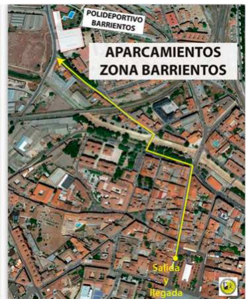
Polideportivo Barrientos C. Obispo Barrientos, 7 Medina del Campo,