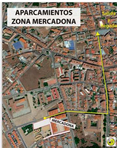
Parking Mercadona C/ José Zorrilla, 20, C. las Eras, 1 Medina del Campo