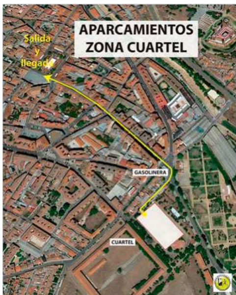
Cuartel Marqués de la Ensenada C/ Cristóbal de Olea, 16 Medina del Campo

Opciones de aparcamientos gratuitos, se encuentran a 5 minutos andando hasta la salida y la meta, situada en la Plaza Mayor de la Hispanidad .